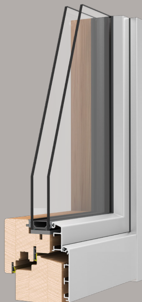
Sistema Easy-Light 68x72 design lineare e linee squadrate

Il sistema Easy-Light 68x72 è stato progettato per la posa a muro in battuta. Il telaio in alluminio di dimensione ridotta e assemblato a 90° consente un sensibile risparmio sul costo del rivestimento.