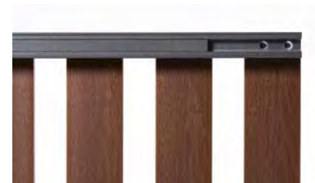
Fissaggio posteriore doghe Griglia con telaio a scomparsa