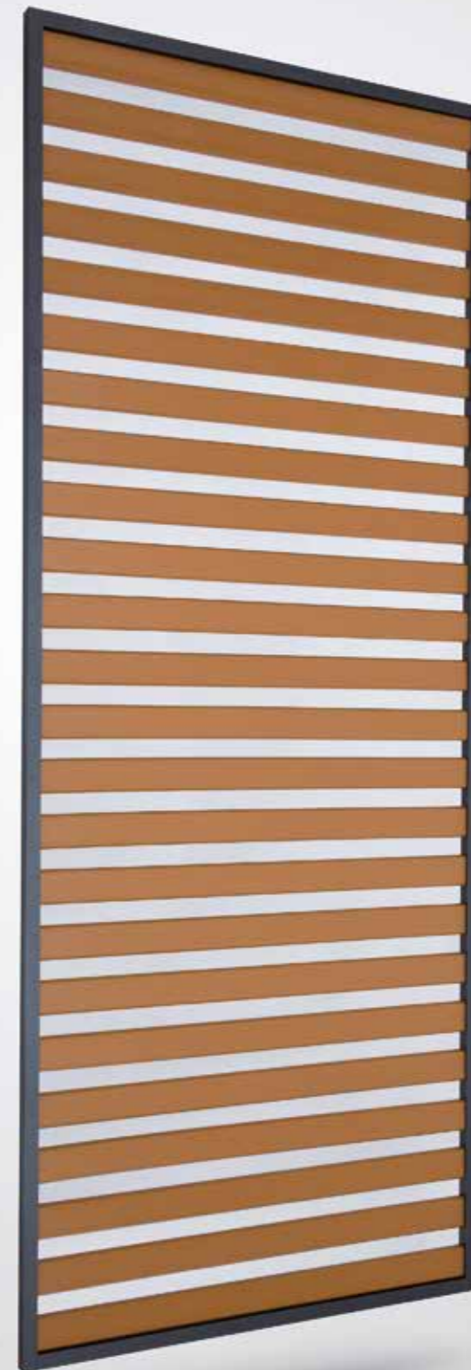
Griglia con telaio a vista - SDG

I Grigliati hanno doghe fisse aventi sezione 70x17mm nella versione con materiale XPS. Il passo standard fra le doghe è di 120mm ma, a richiesta, è possibile variare il passo in funzione delle diverse esigenze architettoniche.