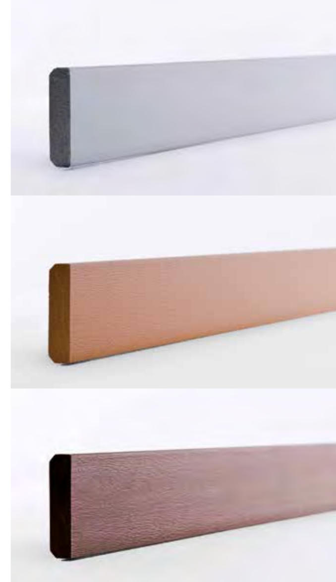
Dettaglio doghe XPS