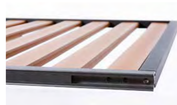
Fissaggio laterale doghe Griglia con telaio a vista