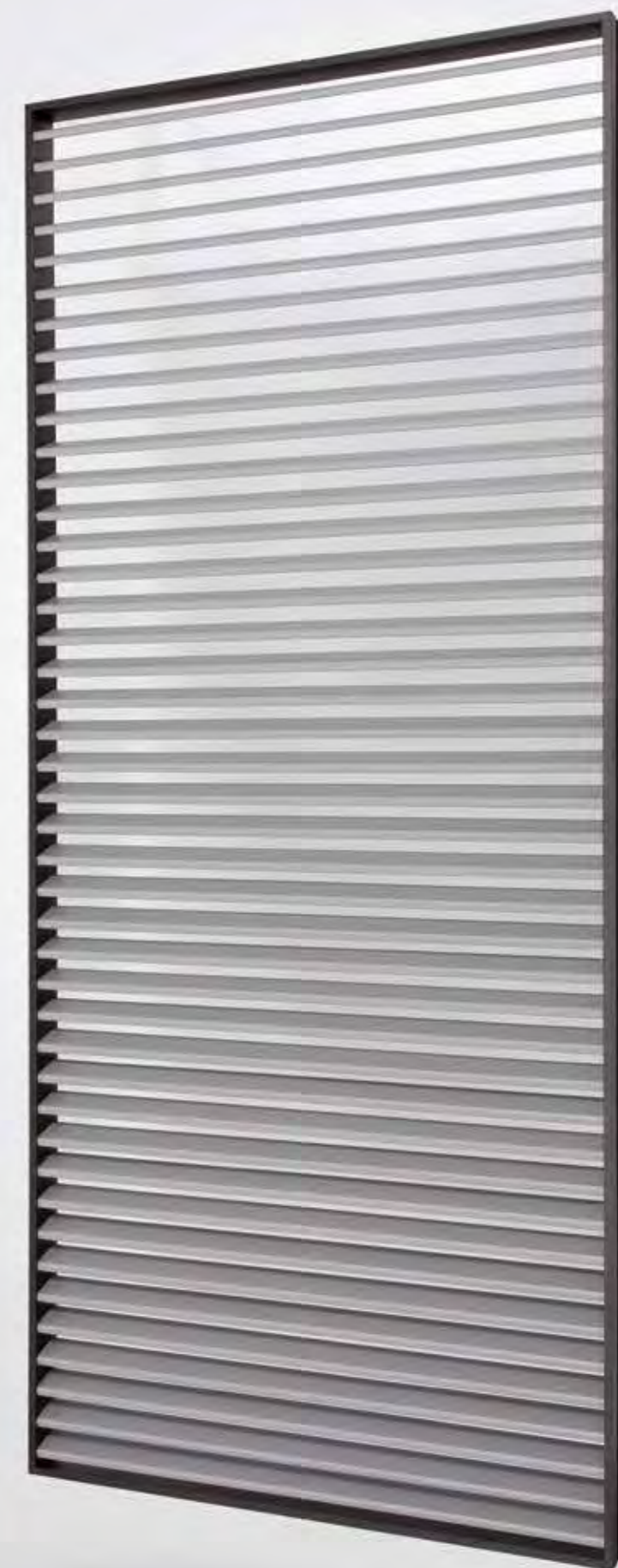
Frangisole - SDF vista esterna