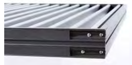
dettaglio assemblaggio/smontaggio doghe