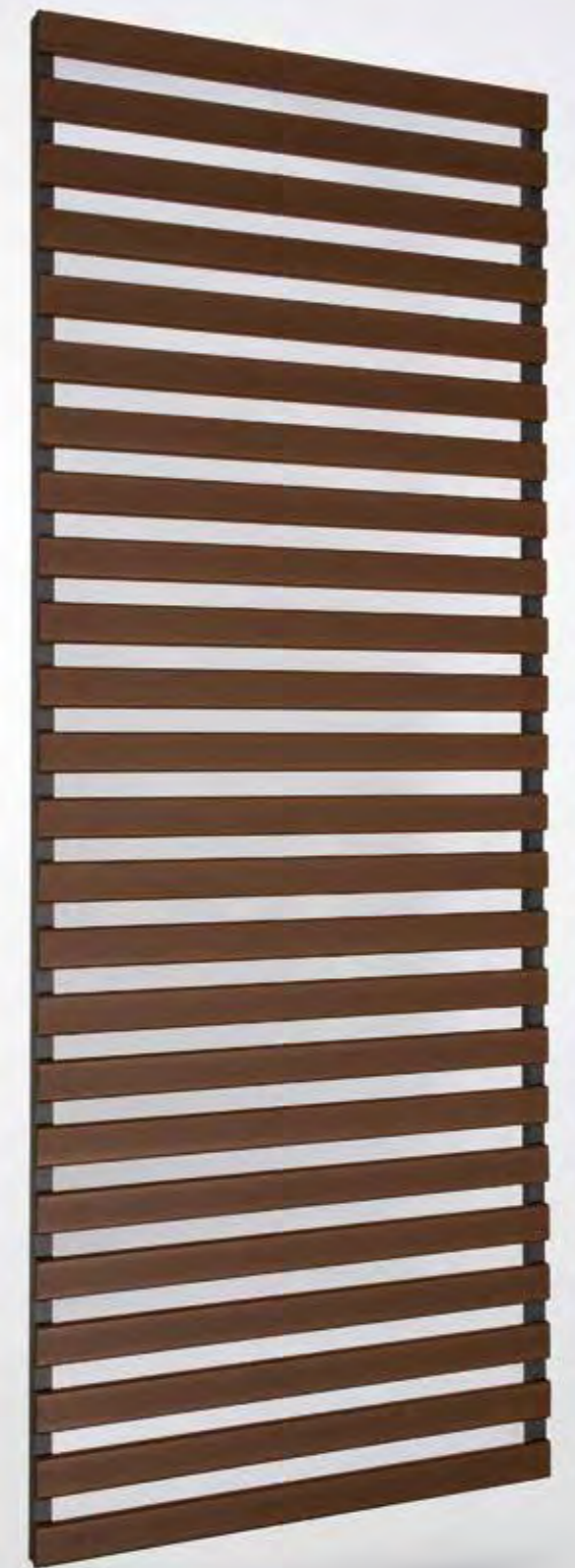
Griglia con telaio a scomparsa - SDH